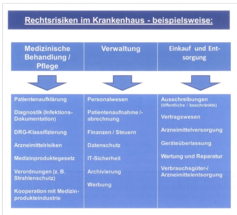
Abb. 1: Wie können Krankenhausorgane ihrer Compliance-Verantwortung nachkommen?

den zurückliegenden Jahren mehr als verdoppelt. Zehn Jahre nach Einführung des Kodex nehmen Presseartikel über „gute Unternehmensführung“ einen Umfang von 12 % der täglichen Unternehmensberichterstattung führender deutscher Medien ein (5% in 2002). Aufgrund kontinuierlicher Steigerung und zunehmender Veröffentlichungspflichten der Kranken-